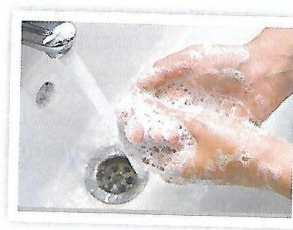
lavar as mãos

"Lava as Mãos", Panda e Os Caricás , Universal Music Portugal, 2012