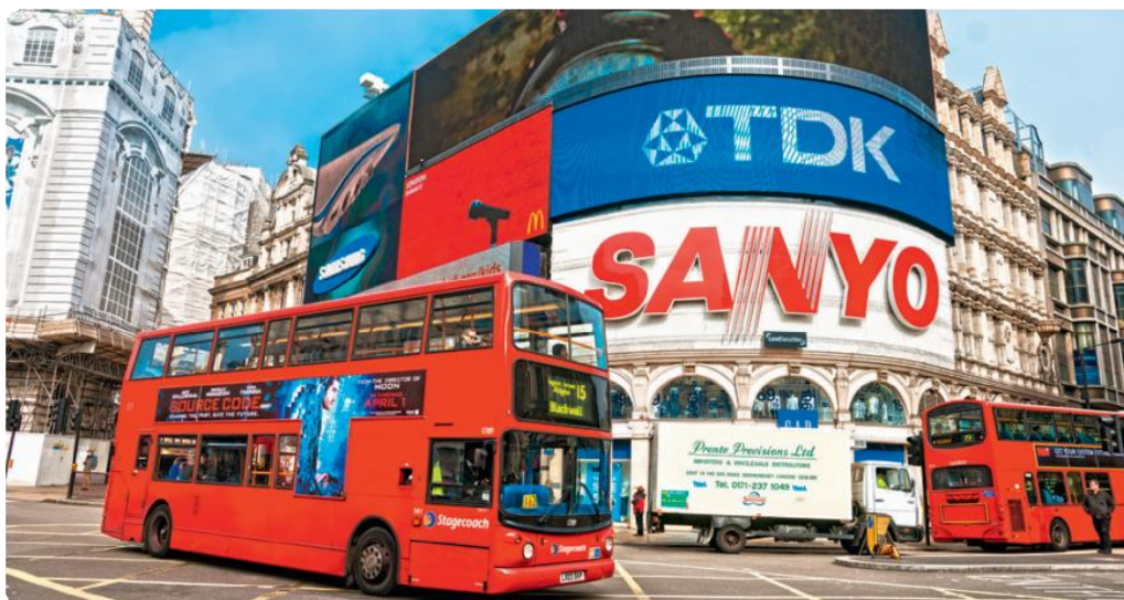
Piccadilly Circus, Londres.